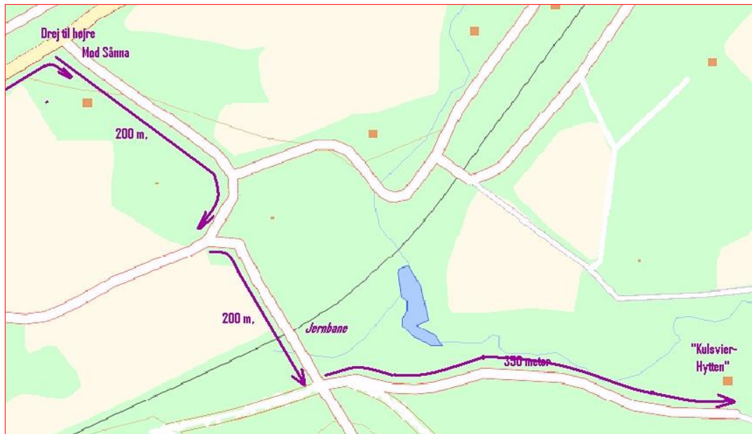
Efter motorvejsbroen til Kulsvierhytten