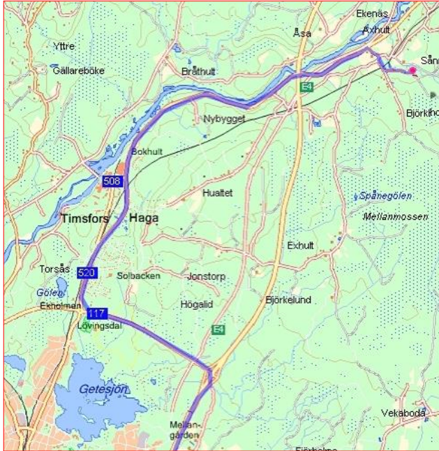
Afkørsel 75 til Kulsvierhytten